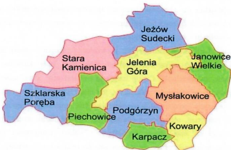
Mapa: Mapa Powiatu Karkonoskiego

Powiat karkonoski położony jest w południowo-zachodniej części województwa dolnośląskiego. Od zachodu i północno-zachodu graniczy z powiatem lwóweckim, od północy z powiatem złotoryjskim, od wschodu z powiatami: jaworskim i kamiennogórskim, a od południa z Republiką Czeską. Powiat karkonoski otoczony jest pasmami górskimi, od zachodu znajdują się Góry Izerskie i Pogórze Izerskie, od północy Góry Kaczawskie, od wschodu Rudawy Janowickie, a od południa Karkonosze. Administracyjny obszar powiatu karkonoskiego wynosi 627,1 km 2 . Na tym terenie funkcjonuje 5 gmin wiejskich: Janowice Wielkie, Jeżów Sudecki, Mysłakowice, Podgórzyn i Stara Kamienica, w tym 46 miejscowości wiejskich oraz 4 gminy miejskie: Karpacz, Kowary, Szklarska Poręba oraz Piechowice.